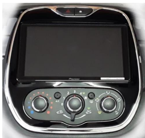
DMH ZS 9380 TV