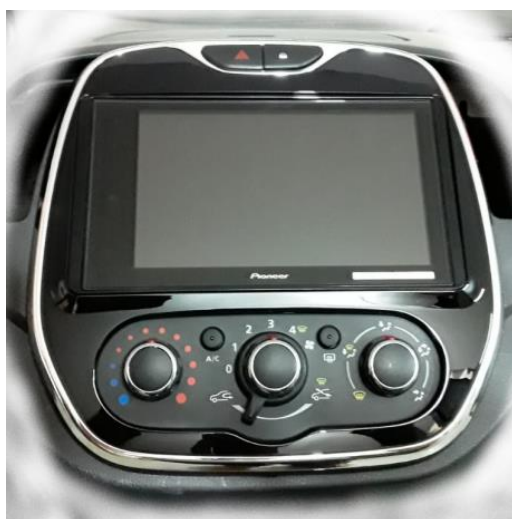
DMH ZS 8280 TV

Passo 4: Efetuar todas conexões. Instalar no painel do carro.